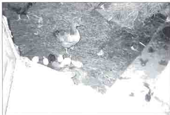
Clueca con sus polluelos en el año 1990