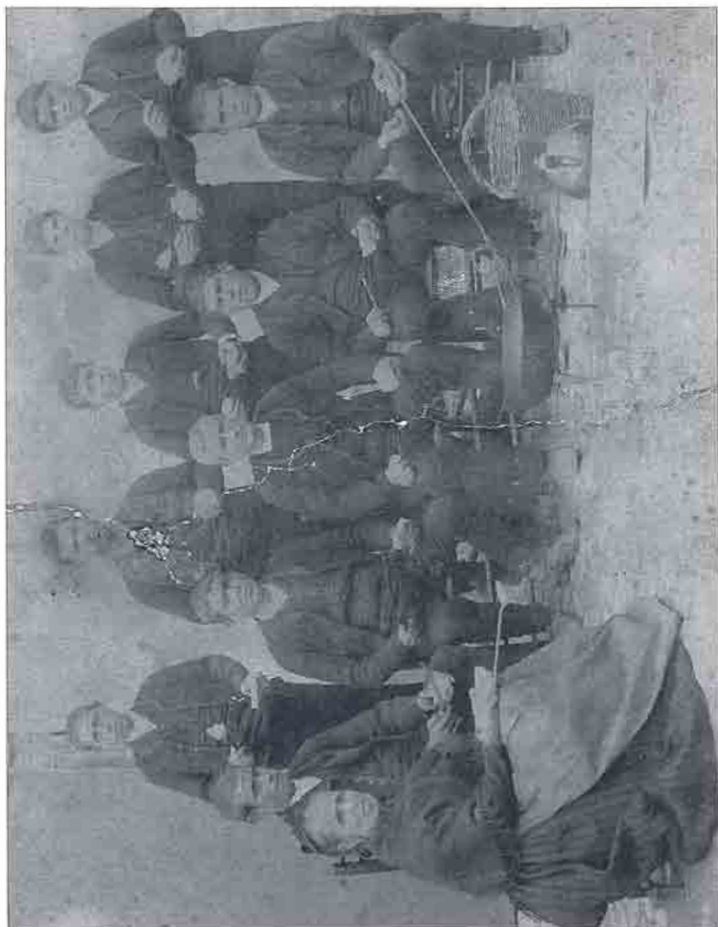
GAÑANES CELEBRANDO EL DIA DE SAN ANTON EN EL AÑO 1895