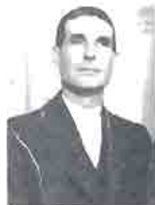
SALUSTIANO SEPULVEDA ORTEGA Presidente durante 25 años