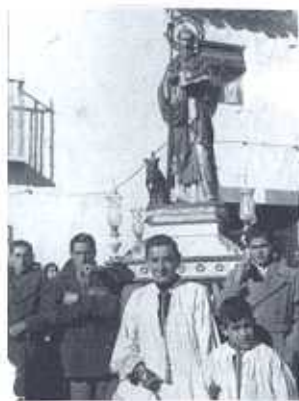
Procesión de San Antón 1940