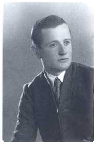
Bodas de Oro en San Antón en su entrada en la Junta con 25 Años

Tengo que decir que llevo 20 años de vocal, 22 de tesorero y 8 de presidente que en total suman 50 años, le doy las gracias a Dios y a San Antón por este privilegio que me han dado durante estos años, he tenido alegrías y disgustos, aciertos y equivocaciones, ruego que me perdonen, como yo perdono, si alguien me faltó porque "el que perdona renuncia a la venganza".