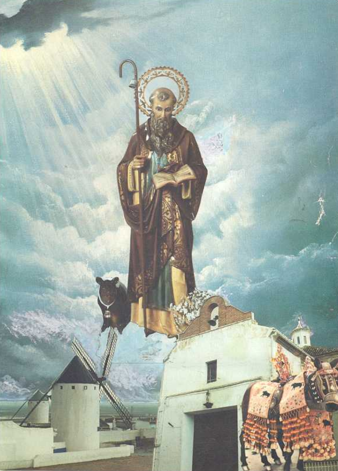
SAN ANTON 93