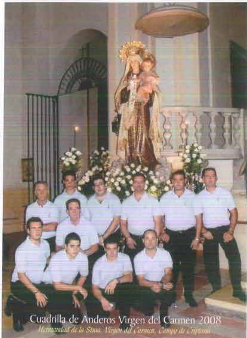
Cuadrilla de Anderos Virgen del Carmen 2008 Hermandad de la Santa Virgen del Carmen, Campo de Criptana