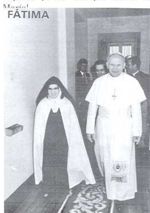
Juan Pablo II ruega por nosotros.

Todavía resuenan las palabras que nos dijo en Madrid ¡Hasta siempre España! ¡Hasta siempre tierra de