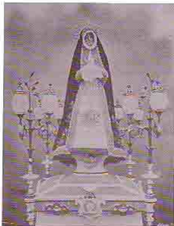
Imagen de Ntra. Sra. de la Soledad, única que se salvó de la guerra civil. La fotografía corresponde a principios de siglo en la que se aprecia la forma singular que era vestida.

En esta fecha, al parecer está incorporada la citada hermandad a la de Nuestra Señora de la Esperanza, de la Corte; según se manifiesta en dicho poder.