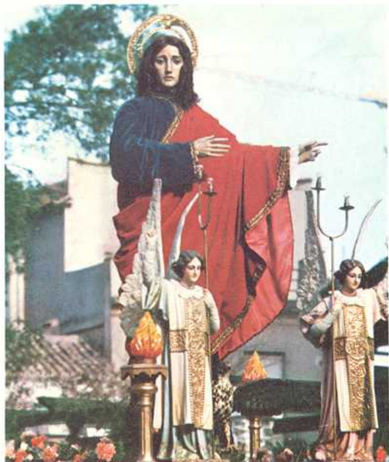
Paso de San Juan Apóstol de la Cofradía del mismo nombre

Te levanto mi voz como una misa de silenciosa ofrenda arrodillada. Te levanto en mis manos la palabra y en mi voz este gesto de querencia.