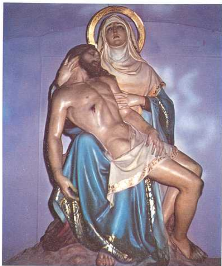
María Santísima de la Piedad de la Cofradía del Santo Entierro

El cuerpo yace inerte entre tus manos. Poco a poco se seca, se enfria, va perdiendo el color como hace el día cuando llega el ocaso. Llantos vanos, rotos, frustados ya, tan solo humanos e impotentes por un Dios. La ironía: Tú lloras por la muerte que El quería, y no comprendes, ni a El ni a los paganos. Lloras, viertes la pena por los ojos y besas a tu hijo y al de Dios que no va a responder a tu lamento. De Jesús solo tienes los despojos; un cuerpo mutilado y Tú, los dos solo. El, te espera en el firmamento.