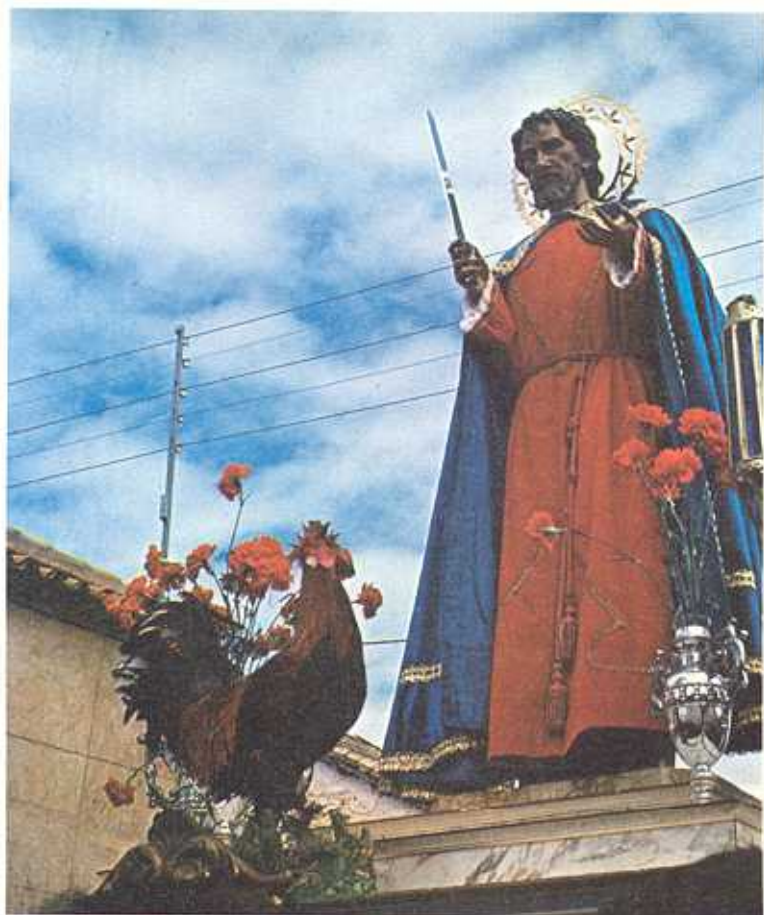
Imágen de San Pedro de la Cofradía de San Juan Apóstol