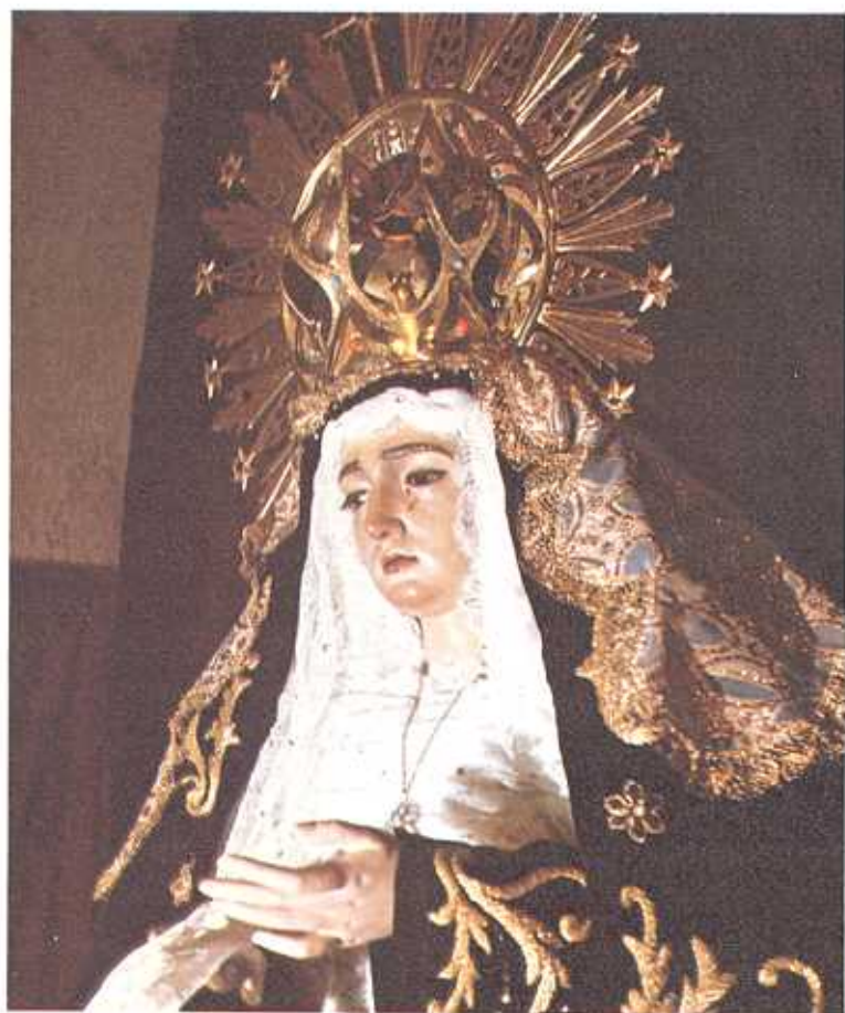
María Santísima de la Soledad. Talla del s. XVII de la Cofradía de Jesús Nazareno

Salobre claridad que se remansa como tallada en piedra eternamente que se fuera a quebrar, perder altura en un fragil instante de mis manos.