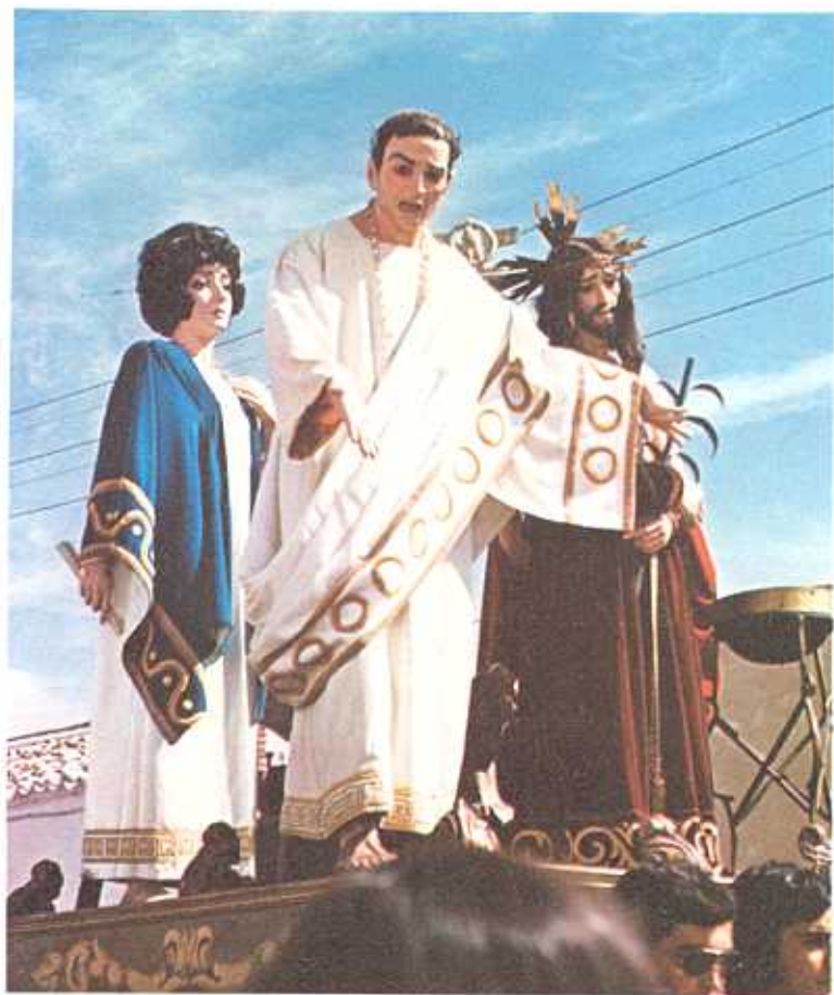
Paso de la "SENTENCIA" de la Hermandad de Jesús Cautivo

..... No sé ni donde estas, pero yo voy andando que andarás; puede que tarde toda mi vida ya por el viaje.