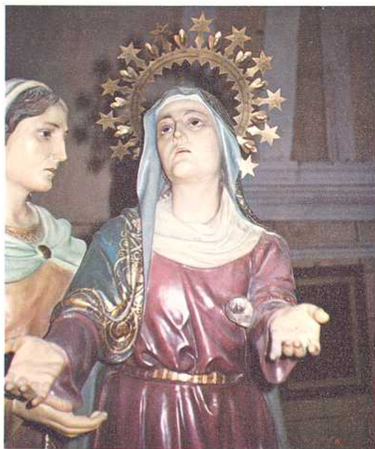
Detalle de María Stma. del Descendimiento de la Cofradía del Cristo de la Columna

Cada peldaño baja hasta tus ojos. Qué múltiple remanso la escalera. La orilla de tus senos es descenso, sorprendida paloma en los bancales de esta sed que en las manos me revuela. Se baja hasta la luz. Irrumpen súbitos los astros en tus ojos, corzas rápidas en una desnudez breve y nocturna. El rellano es la sangre alborotada. No se hace aurora aún, el fuego sube y prende en tus cabellos y en los montes, piedra y piedra, de nuevo, eternamente, más cada vez tus ojos insondables descendiendo a los míos en lo oscuro. No se escala el amor, valle infinito.