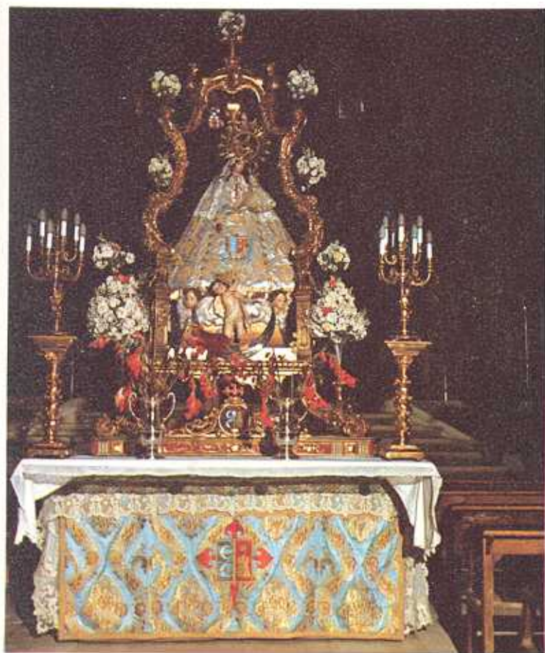
Santísima Virgen de Criptana Patrona de la Villa