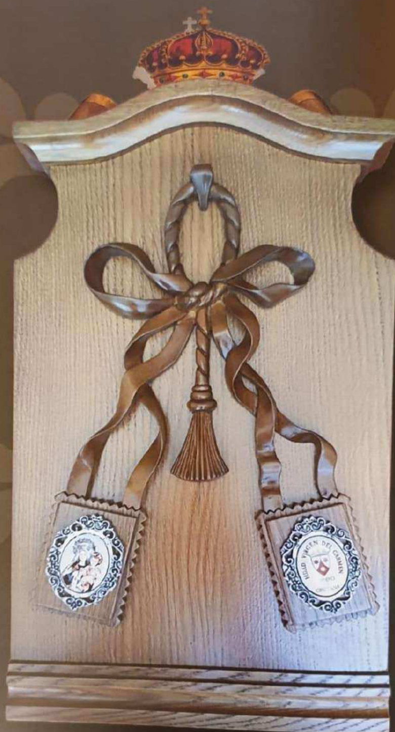
✦ Talla de los escapularios en el lateral de las andas ✦ de la Santísima Virgen del Carmen, realizado por Martín Violero.