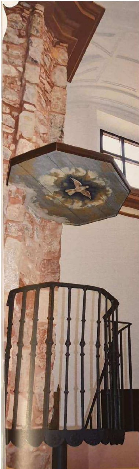
Fiestas en Honor de la Santísima Virgen del Carmen