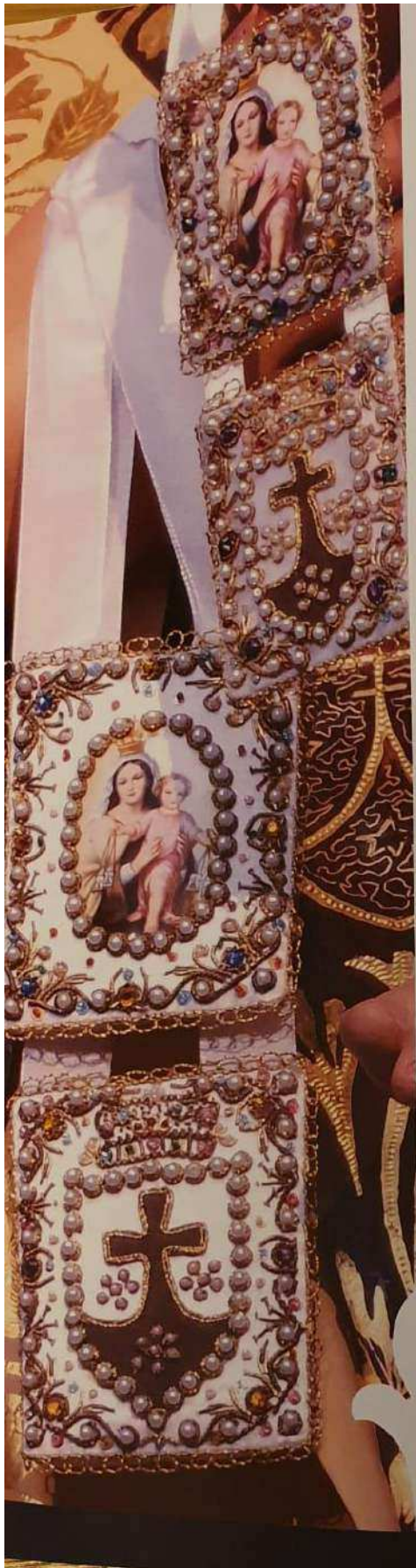
Fiestas en Honor de la Santísima Virgen del Carmen