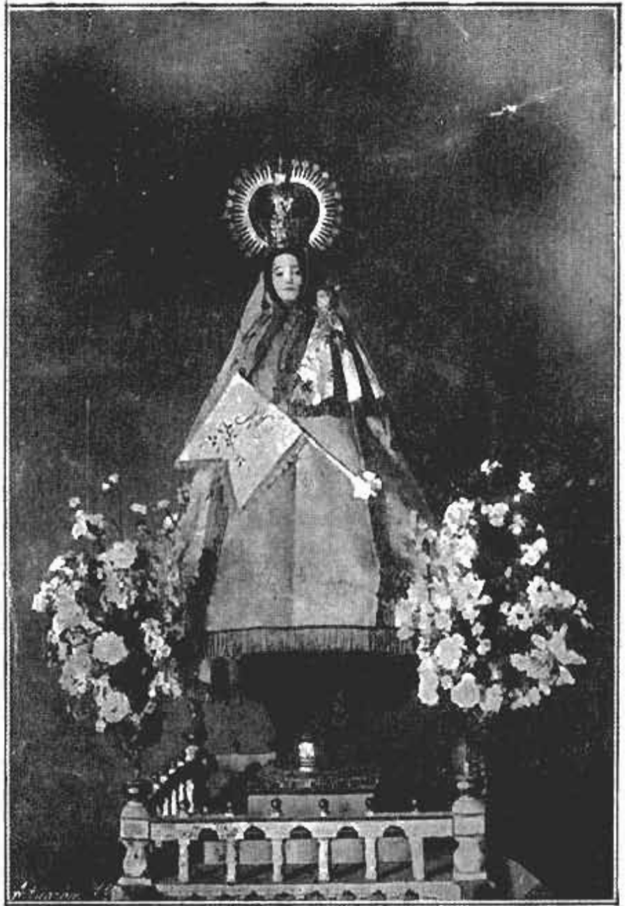
Imagen de la Santísima Virgen de la Paz desaparecida en el año 1936