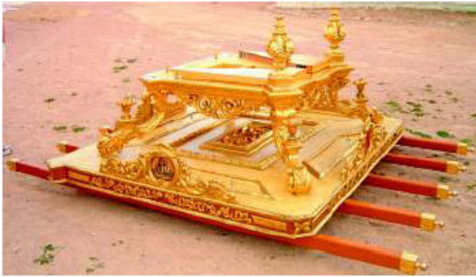
ESTADO DE LAS ANTIGUAS ANDAS