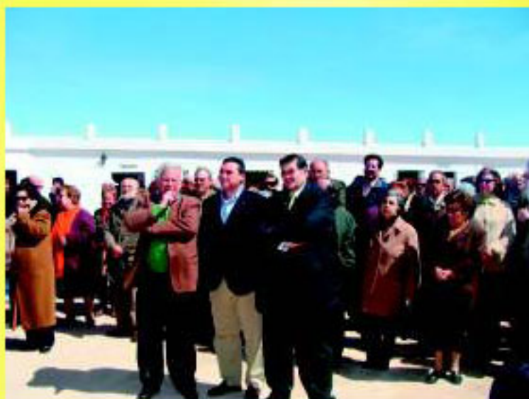
Santiago Lucas-Torres López-Casero Alcalde de Campo de Criptana