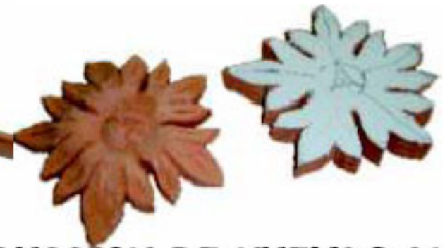
CONSTRUCCION DE NUEVAS ANDAS