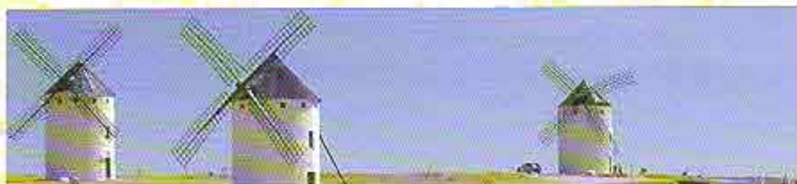
Campo de Criptana. Agosto de 2004

EDITA: Excmo. Ayuntamiento de Campo de Criptana. Concejalías de Festejos y Cultura FOTOGRAFÍAS: BETA Comunicación y Diseño, S.L. y Ayuntamiento de Campo de Criptana MAQUETACIÓN Y DISEÑO: Blancowhite Comunicación Gráfica, S.L. IMPRIME: Artes Gráficas Díaz-Hellín, de Campo de Criptana