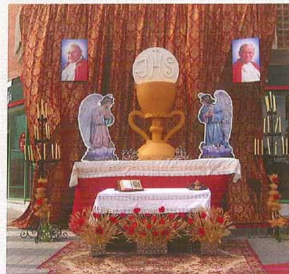
Altar Hdes. de Gloria