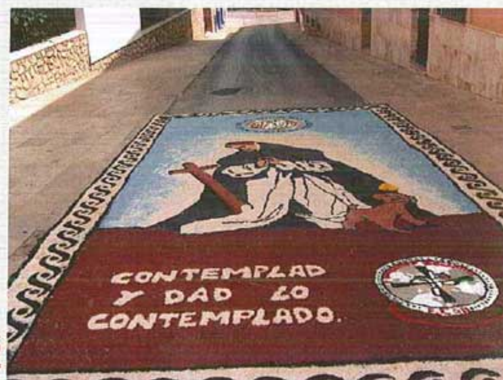
Alfombra Colegio Dominicas