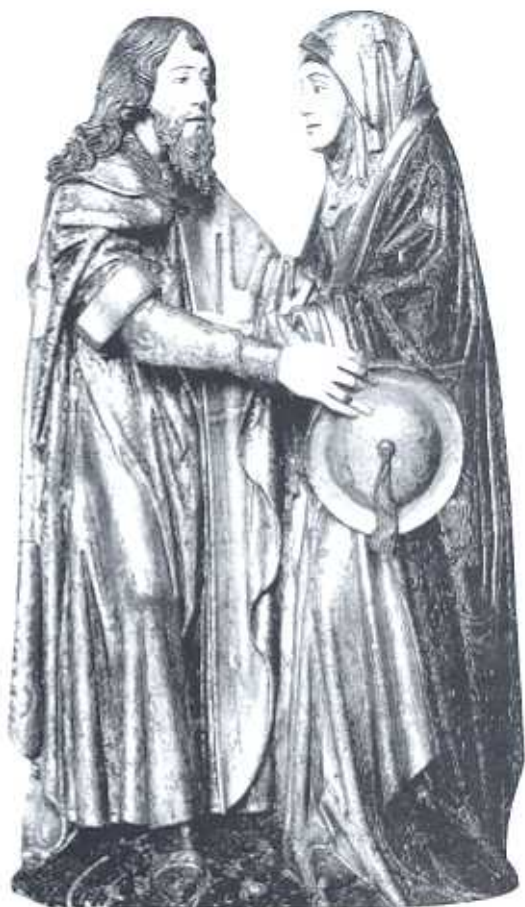
San Joaquín y Sta Ana - Tabla románica Siglo XVI Paredes de Nava - PALENCIA.

Este es San Joaquín: un hombre amable y ejemplar, padre de la Virgen María, cuya vida nos ha sido transmitida por la tradición cristiana.