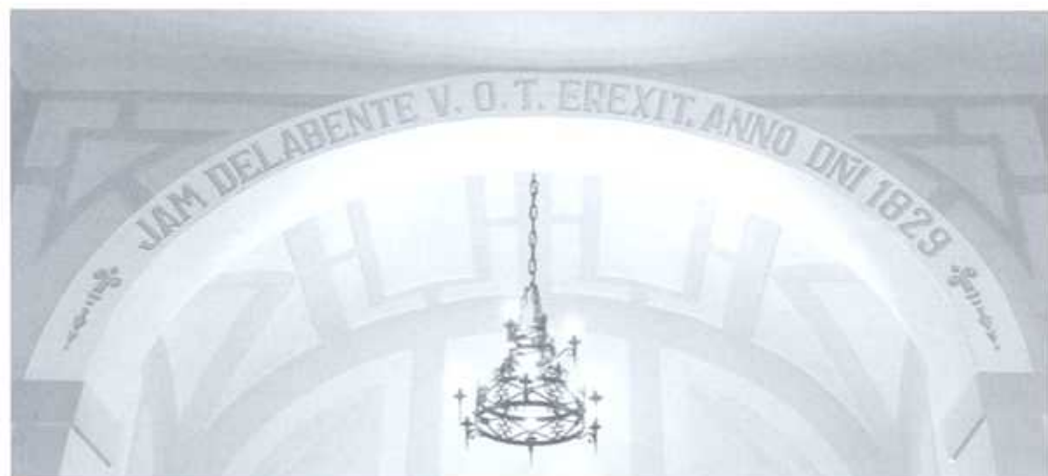
Detalle del Arco Realizado por Miguel Quintanar