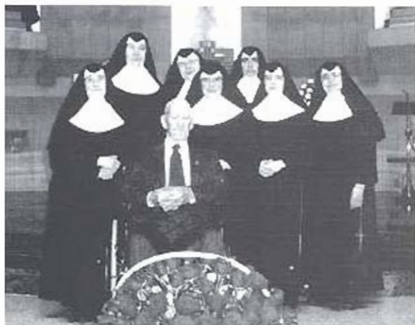
Comunidad de religiosas de los ancianos desamparados Campo de Criptana.

Esto es lo que con la Gracia de Dios tratamos de realizar en nuestra residencia, brindarles a nuestros acogidos un ambiente de paz, convivencia fraterna, unión con Dios. Lo hacemos siguiendo la invitación de Cristo que mira como echo A El lo que se hace por los mas pequeños y débiles de la sociedad, y a la vez tratamos de ser desde ellos para el mundo reflejo creíble de su amor y su misericordia.