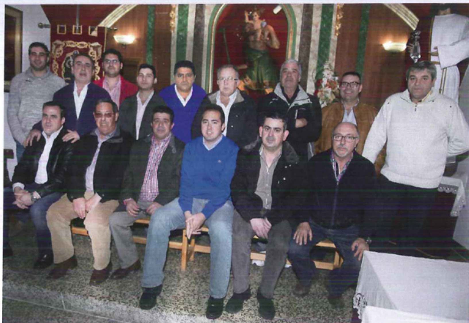
Junta actual hermandad de San Cristóbal

Así en febrero de 1969, el papa Pablo VI ordenó revisar el calendario litúrgico para suprimir los santos de cuya existencia no hubiese pruebas. Eso no significa que los «descanonizara», sino simplemente que su celebración y veneración no es obligatoria.