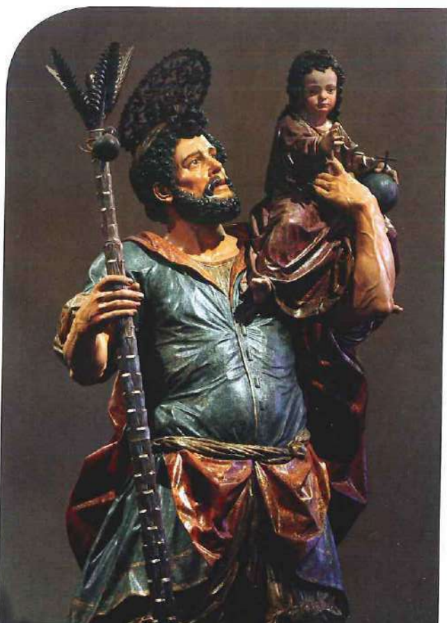
San Cristóbal, obra de Juan Martínez Montañés