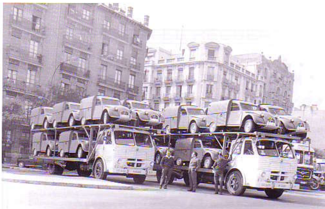
Camiones porta-coches propiedad de la familia Huertas transportando coches Citroën. En el centro Antonio Huertas junto con dos conductores. Año 1950