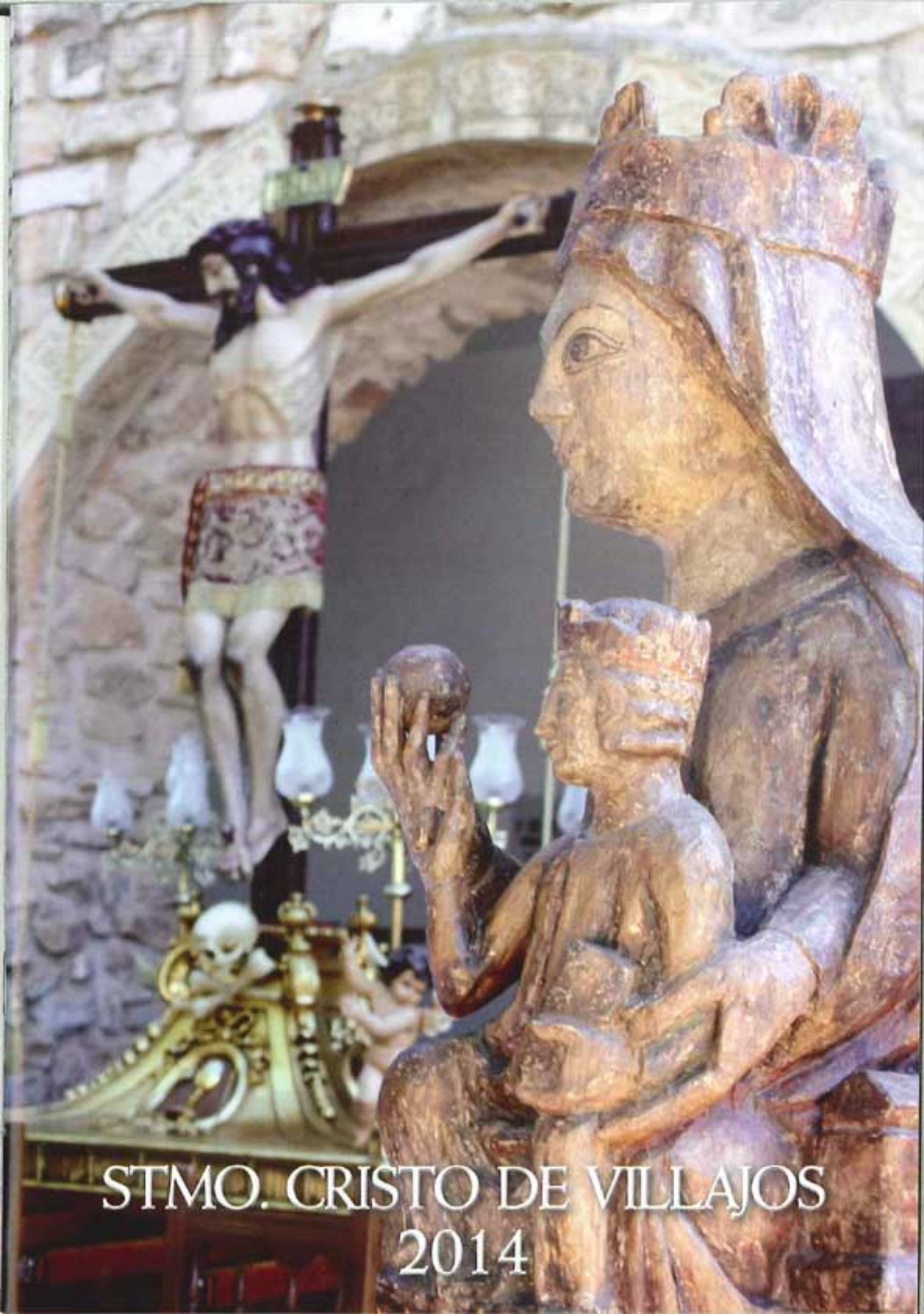
STMO. CRISTO DE VILLAJOS 2014