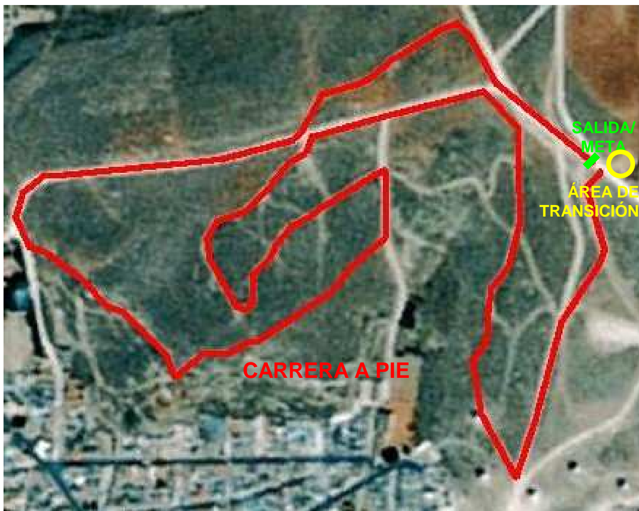
PERFIL CARRERA A PIE