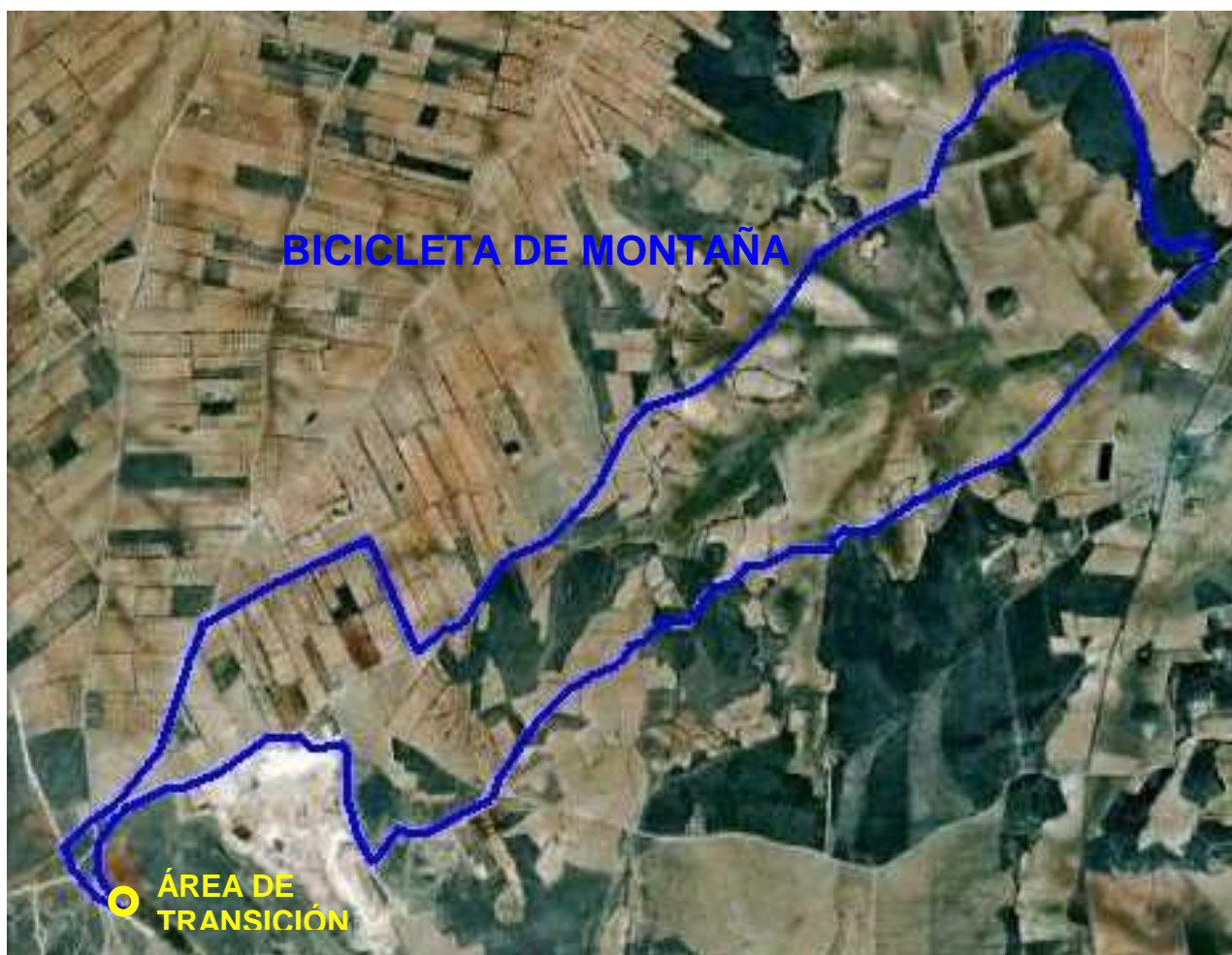
PERFIL BICICLETA DE MONTAÑA